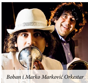
Boban i Marko Marković Orkestar