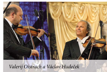
Valerij Oistrach a Václav Hudeček