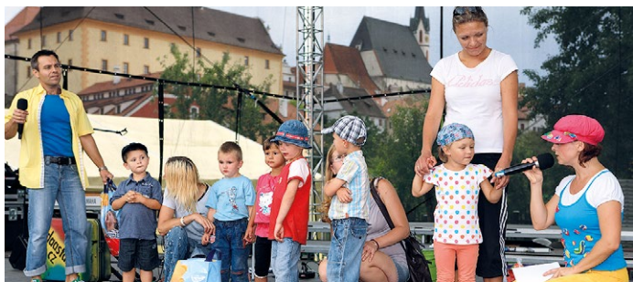
Dětské odpoledne v rytmu energie