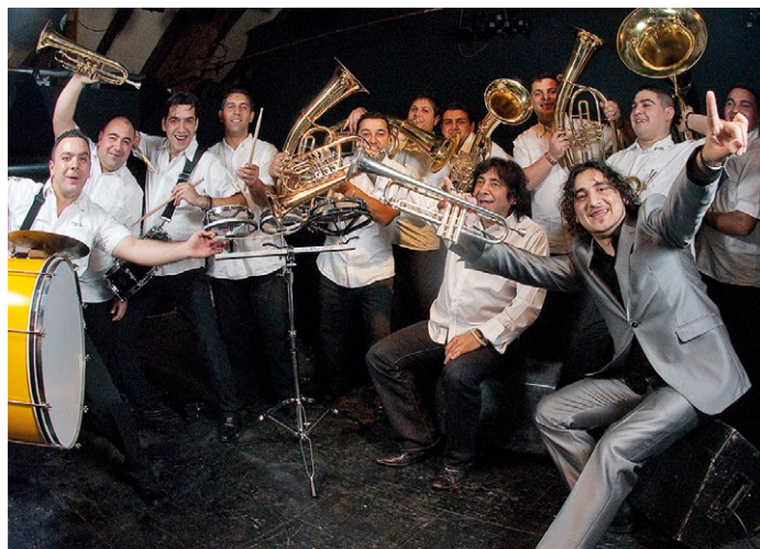
Boban i Marko Marković Orkestar

A sobota patří zážitkům nejen pro uši a pro duši, ale také pro mlsné jazyčky. V Pivovarské zahradě se totiž koná další z hudebně-gastronomických večerů. Tentokrát patří Balkánu, jmenovitě skvělému souboru Boban i Marko Marković Orkestar ze Srbska, jakož i tamním delikatesám. Zazní řada skladeb ve svižném rytmu balkánské dechovky, jakou důvěrně známe z filmů