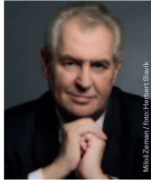
Miloš Zeman