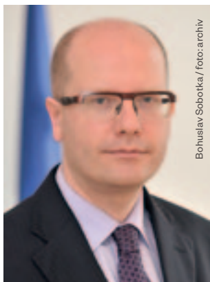
Bohuslav Sobotka

Dear friends of the International Music Festival Český Krumlov,